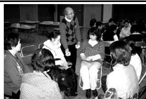
みんなで楽しくゲーム！