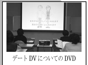
デート DV についての DVD

● 子育て支援の現場でも人権・ジェンダー・DV の研修を取り入れていきたいと思えます。