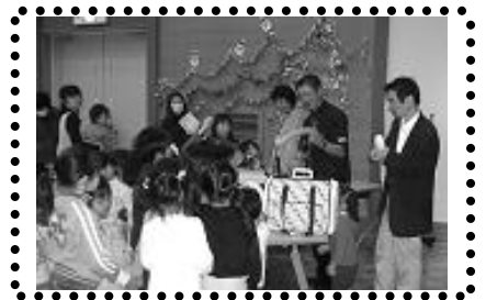
参加者 147 名