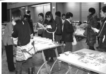
本とおもちゃも大好評！