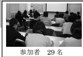
参加者 29 名

● 子育て支援の現場でも人権・ジェンダー・DV の研修を取り入れていきたいと思えます。